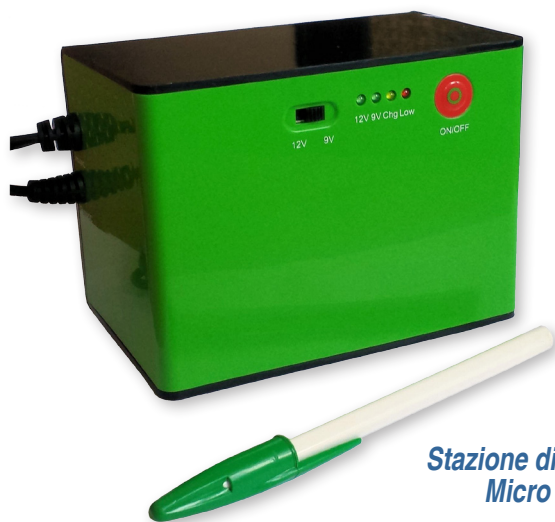
Stazione di energia Micro DC